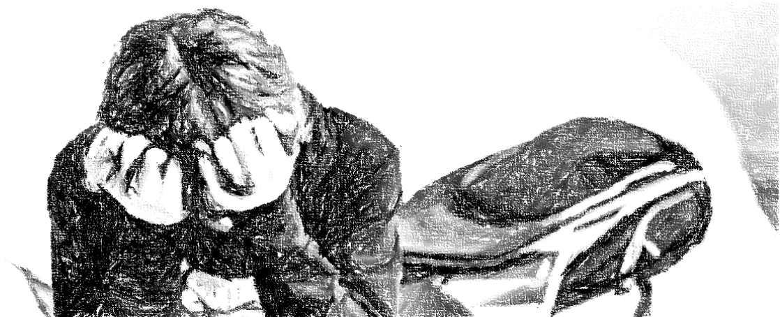
Figure 1 : Harcèlement en milieu scolaire.

Réalisé par : Eloïse Rebetez et Mathilde Dubey